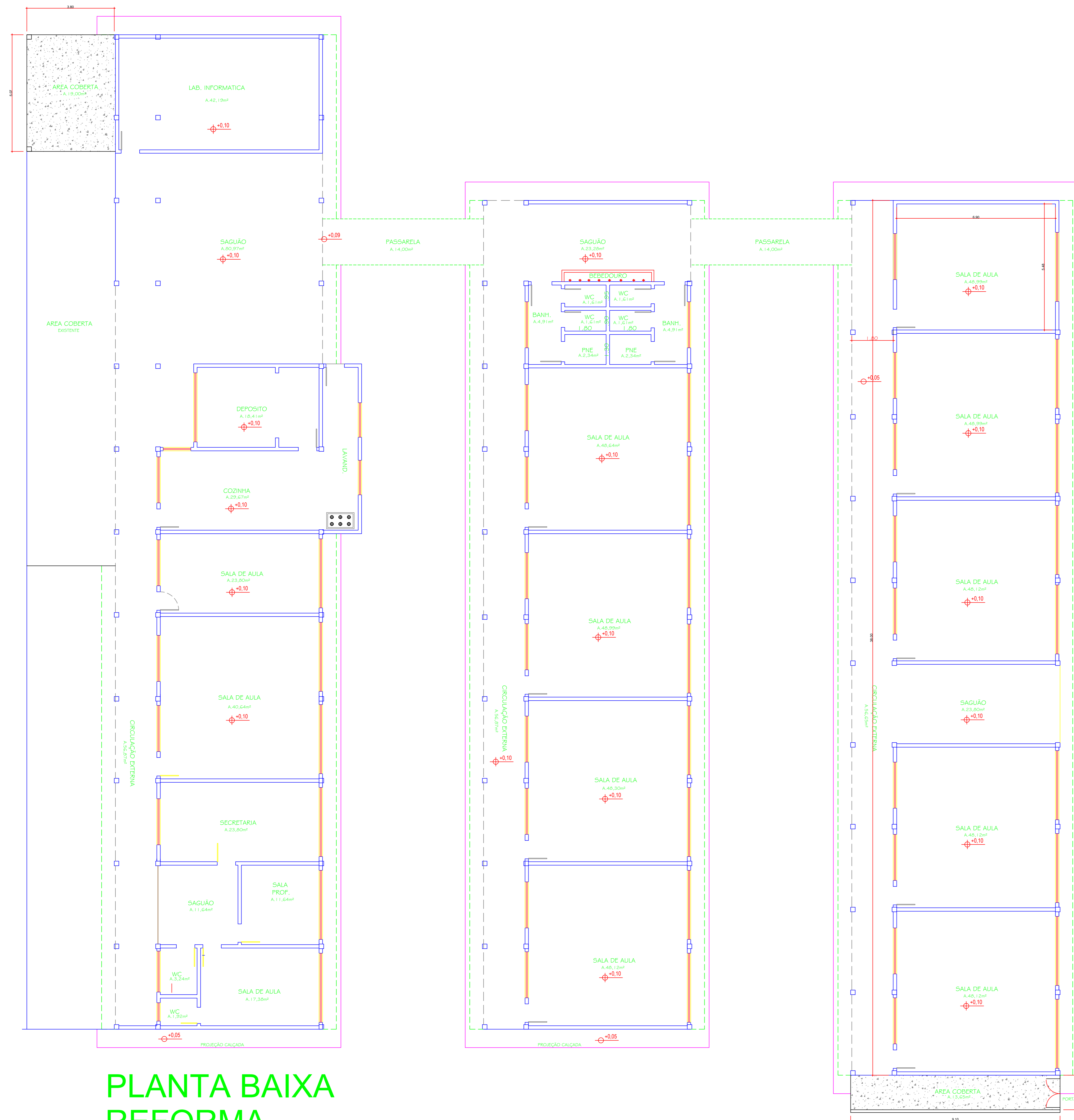
PLANTA BAIXA REFORMA ÁREA: 654,17 m 2 ESCALA 1/100