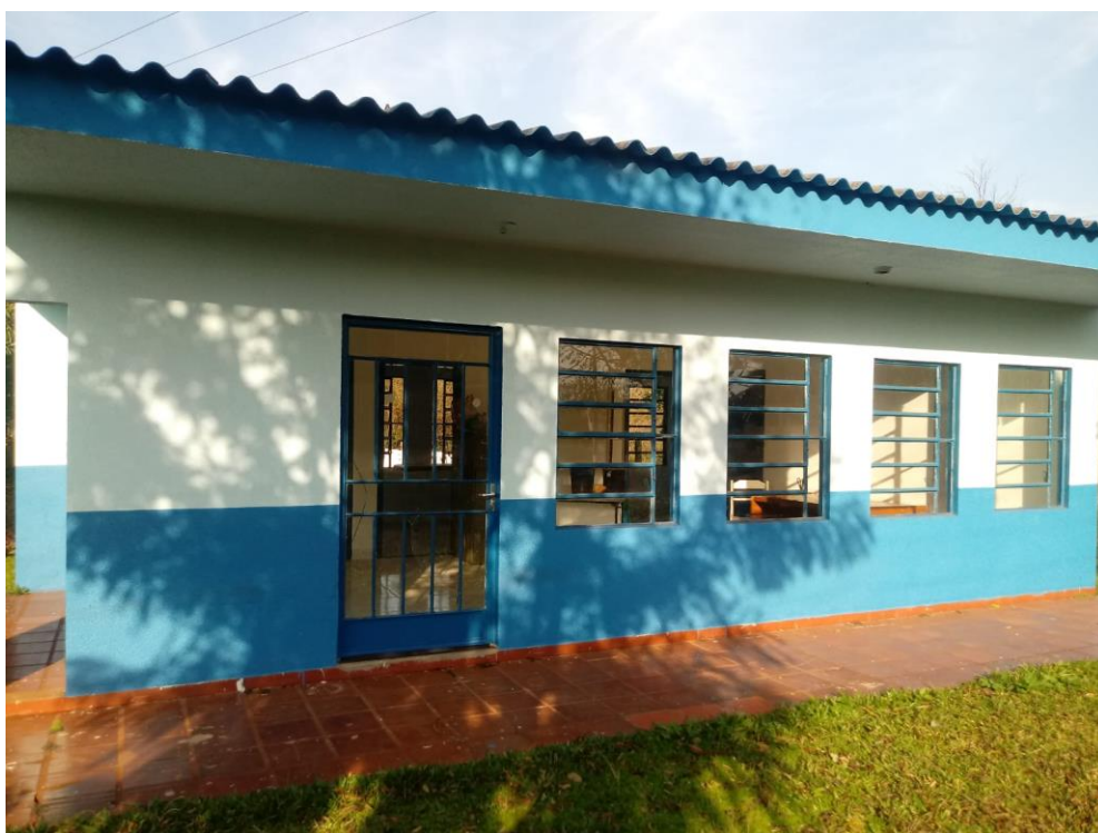
Figura 1 – Fachada Principal;