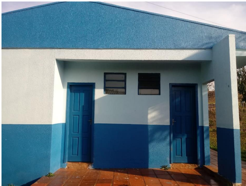
Figura 4 – Elevação Lateral;