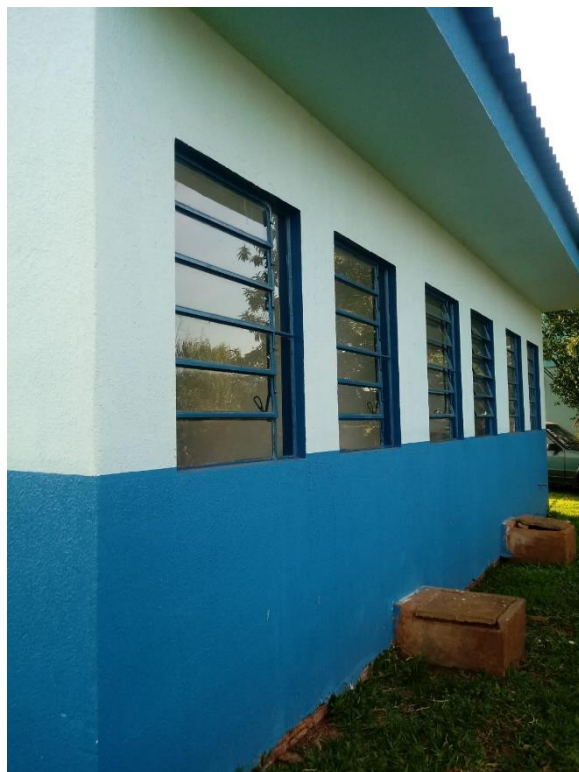
Figura 5 – Elevação Lateral;