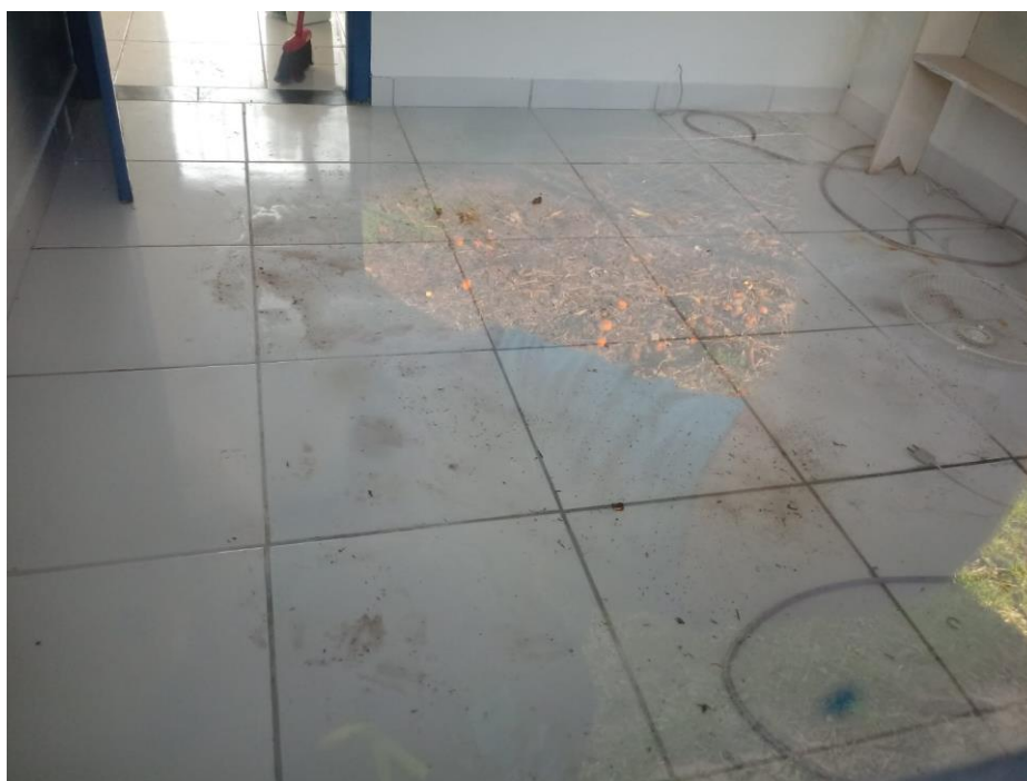
Figura 13 - Consultório;