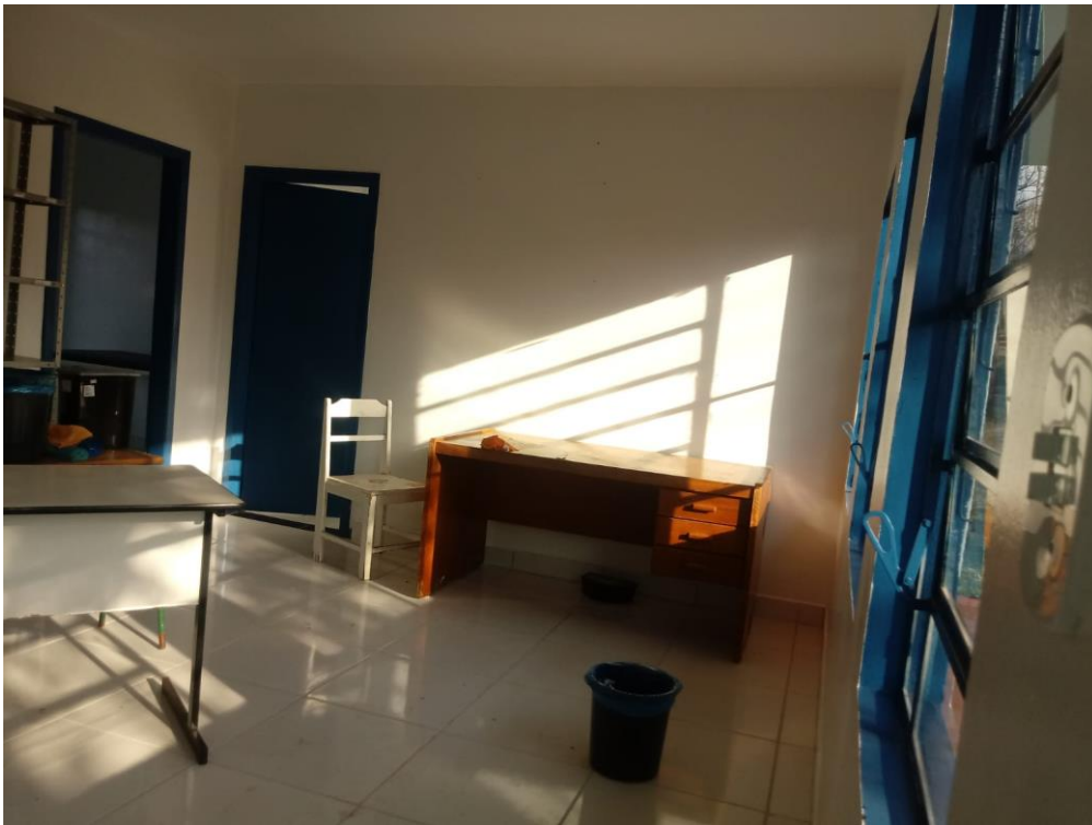
Figura 8 - Recepção;