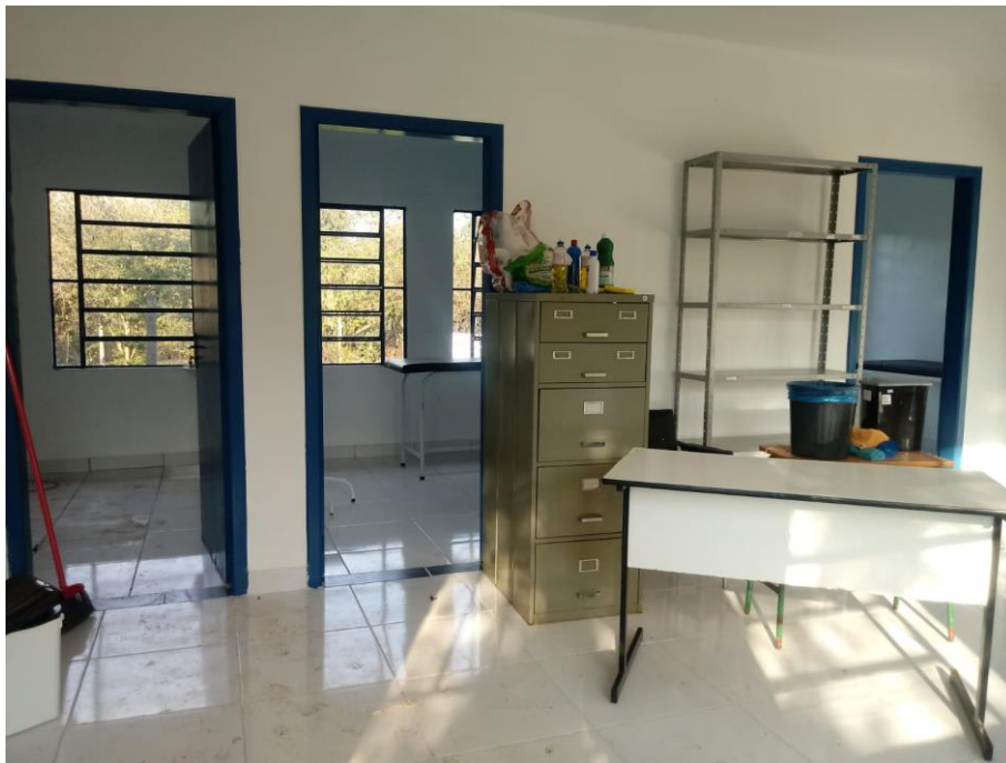
Figura 7 - Recepção;