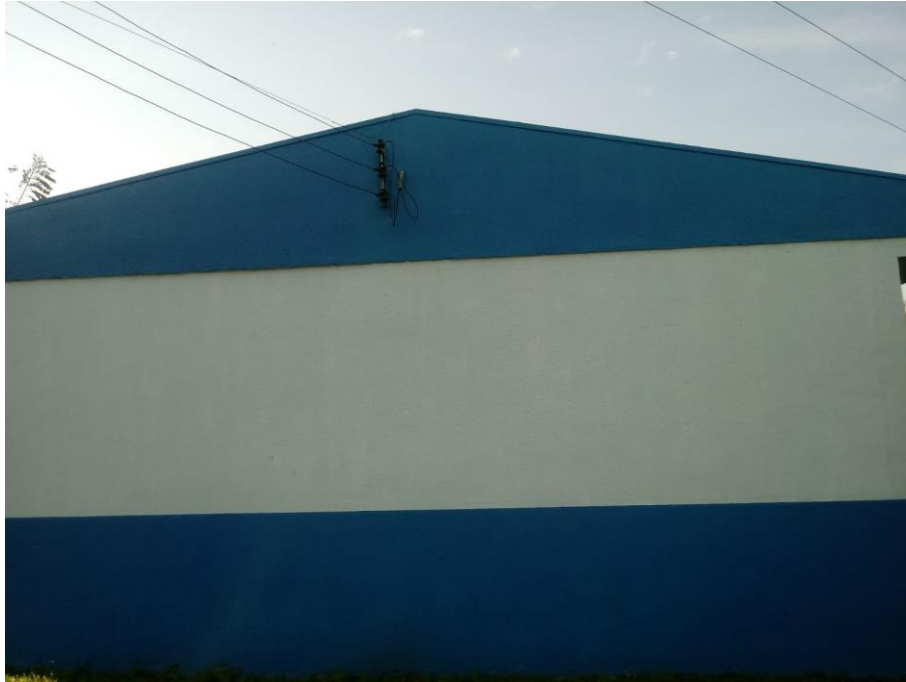
Figura 2 – Elevação Lateral;