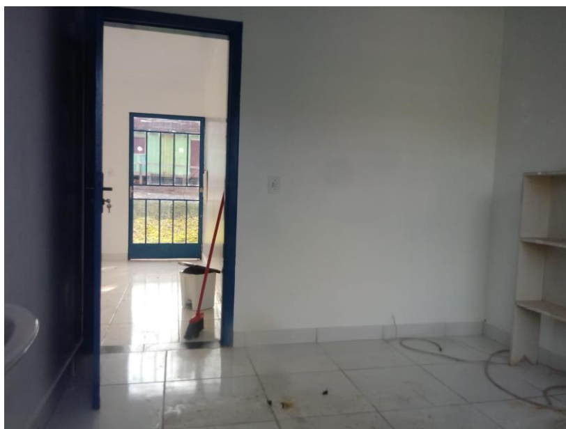
Figura 10 – Consultório de Dentista;