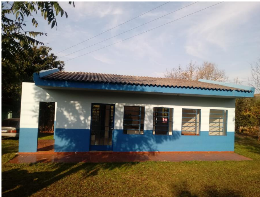
Figura 3 – Fachada;