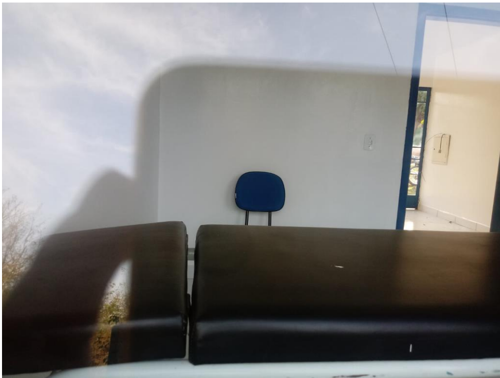
Figura 9 - Consultório;