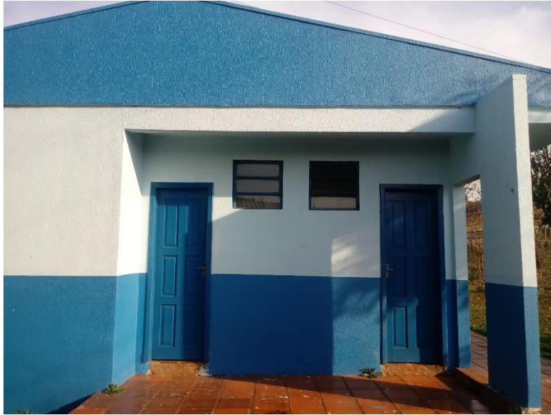
Figura 6 – Elevação Lateral;