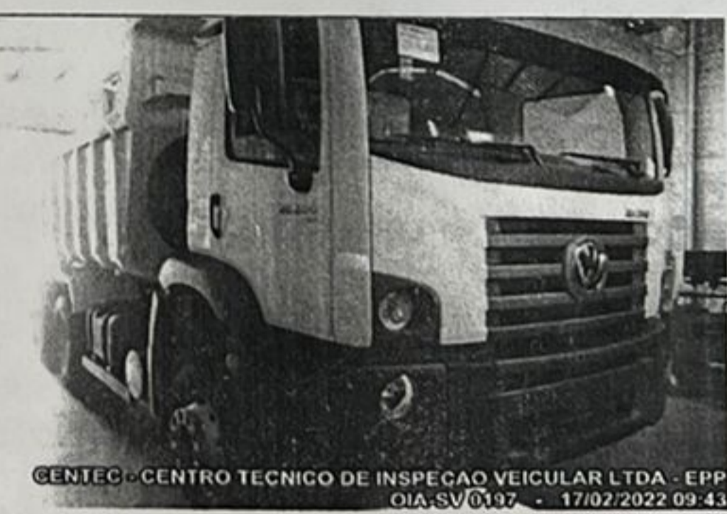
CENTEC - CENTRO TECNICO DE INSPECAO VEICULAR LTDA - EPP OIA-SV 0197 - 17/02/2022 09:43