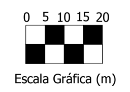
Planta Baixa - Definição de Taludes escala 1/1.000

Deverá ser reflorestado o entorno do Rio Aurora uma faixa de 15,00m, com espécies nativas de região. Área de Proteção: 5.424,56m² Quantidade de Árvores: 510 unidades * Observar Tabela